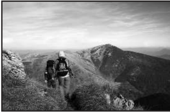
Mountain walking: Michal Marcol / FreeDigitalPhotos.net; http://www.marcol.pl/