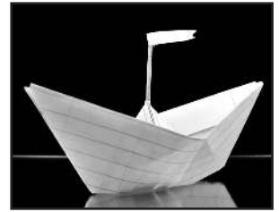
Paper boat: Carlos Porto/ FreeDigitalPhotos.net; http://www.myshutterspace.com/profile/CarlosPorto

In Deutschland werden jährlich 200 Millionen Schulhefte verkauft. Nicht einmal zehn Prozent davon sind aus Recyclingpapier. Mitschuld tragen die verwirrenden Etiketten. So wird „holzfrei weißes Papier“ durchaus aus Holz(-fastern) hergestellt. Tipp: Auf das Zeichen „Blauer Engel“ achten. Dies garantiert, dass das Heft zu 100% aus Altpapier besteht.