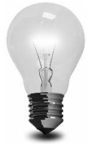
Light bulb: posterize/FreeDigitalPhotos.net; http://www.posterize.com/

Zu viele Schalter im Klassenzimmer für viele einzelne Lampen – und keiner kann sie auseinanderhalten. Die Folge: Auch wenn es nur in einer Ecke dunkel ist, werden aus Bequemlichkeit oft alle Leuchten angeknipst. Beschriftungen für die Schalter bringen Übersicht in den Lichterschungel und helfen auf diese Weise beim Stromsparen.