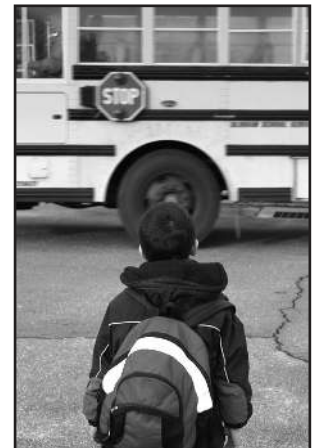
School bus: Arvind Balaraman/FreeDigitalPhotos.net; http://arvindbalaraman.com/