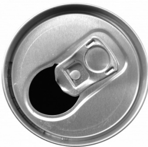
Can: Suat Eman/FreeDigitalPhotos.net; http://suateman.weebly.com/