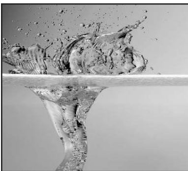
Water splash: Idea Go/FreeDigitalPhotos.net

Dass die Fahrt zur Schule mit dem Fahrrad gesünder und umweltschonender ist als im Auto, weiß jedes Kind. Trotzdem geben nur wenige Schulen Anreize, dauerhaft auf den Drahtesel umzusteigen: zum Beispiel mit einem schön gestalteten und einbruchssicheren Fahrradkeller oder einer betreuten Werkstatt auf dem Schulgelände.